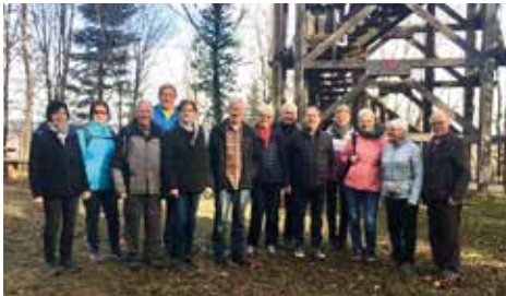
Am Riesbergturm bei Murrhardt.

AGBs und Datenschutz-Hinweise – siehe STB-Jahresprogramm 2024 und TG-Jahrbuch: 2024.