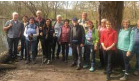
An der Enz bei Markgröningen.