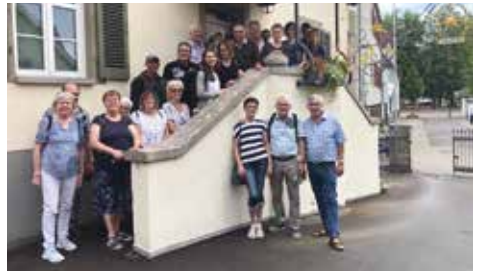
Vor dem Heimatmuseum in Welzheim.